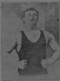
Carl Grunewald. — (Alemán.)

Altura: 1.86 mts.; pesa 122 kilos, llamado el Hércules de España, es sin disputa el hombre más fuerte de nuestra época; mide cada húmero 50 cm, bíceps y de pectorilla. Ha triunfado en toda Europa; levanta 50 kilos en cada brazo estando extendidos; mantiene 100 kilos sobre su cabeza; los levanta a 4 u. un toro con sus manos y ha detenido un tronco de caballo con sólo un brazo; diez automóviles encadenados, uno de cada brazo no pueden hacerlo mover del punto donde se coloca.